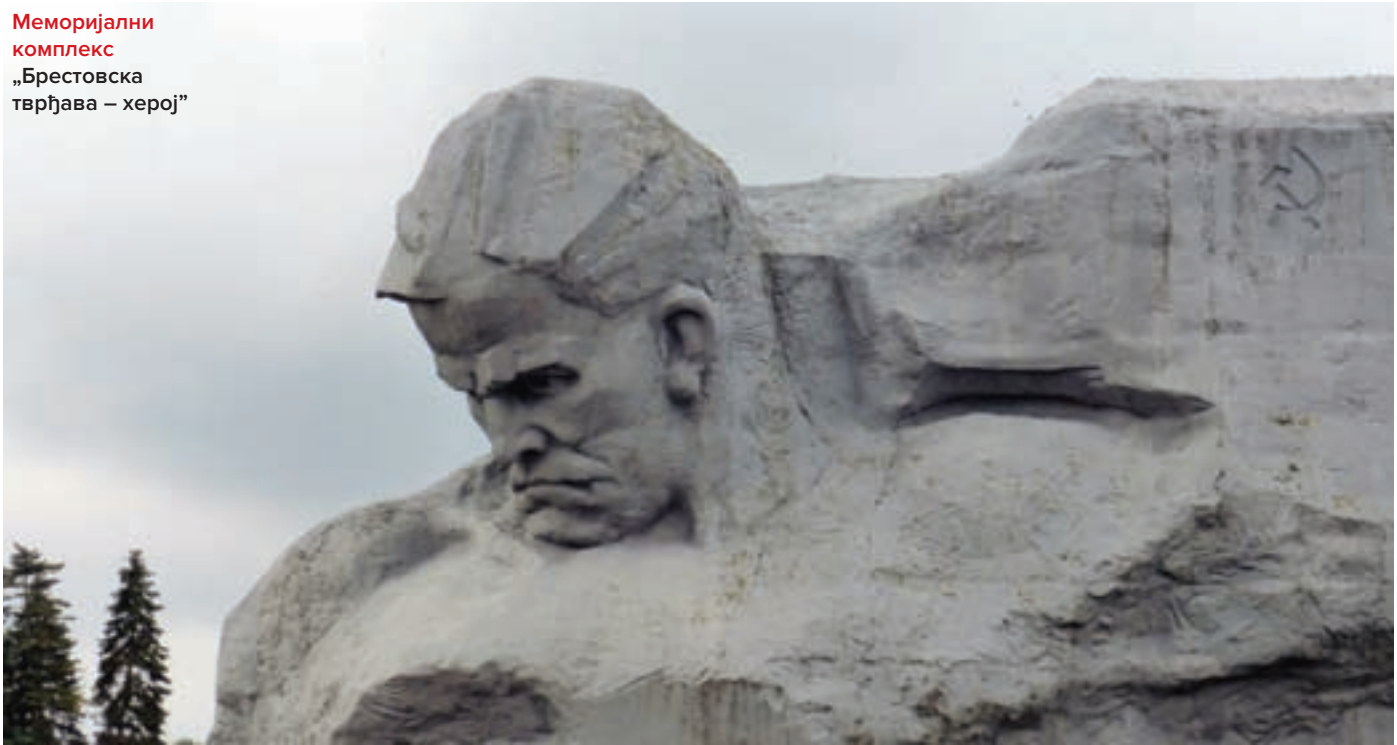
Меморијални комплекс „Брестовска тврђава – херој”

шуме, мелиорисано земљиште, изнад свега – људе. Они чине душу једне земље, осликавају њено лице, чине је посебном од других. Верујем да сам их схватио. Настањени су на коридору највећих нововременских ратова и несрећа. И када се питате зашто су Белоруси такви, трпељиви, мирни, радни, законопослушни, говорили су ми да су такви јер у себи, а и на глас понекада, понављају – само да рата не буде.